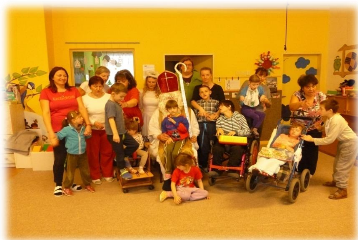
Žáci MŠ Český Těšín s paní učitelkou

Vzdělávání v mateřské škole je realizováno prostřednictvím ŠVP „Z pohádky do pohádky“, který dále je zpracováván do třídních vzdělávacích programů. Ve třídách se pracuje dle třídního vzdělávacího plánu, který se naplňoval a průběžně se hodnotil. Zaměřovali jsme se na individuální péči, rozvoj motoriky, logopedii a grafomotoriku. Velký důraz byl kladen na environmentální výchovu (EVVO). Třídní výchovný plán byl v průběhu roku doplňován o další akce. Cílem je spokojené dítě, které je vedeno k rozvíjení jeho schopností a dovedností. S dětmi pracujeme individuálně. V případě doporučení SPC mají děti vypracován individuální vzdělávací plán (IVP). K dětem přistupujeme s ohledem na jejich postižení. Obsah TVP vhodně doplňuje projekt „Celé Česko čte dětem“, hipoterapie, logopedie či canisterapie. Úspěšně probíhal rozvoj komunikačních, poznávacích a pohybových dovedností. Děti měly prostor k rozvíjení své fantazie a tvořivosti. Intenzivně spolupracujeme s rodiči prostřednictvím každodenního setkávání. Rodiče se podílejí na tvorbě individuálních plánů svých dětí a konzultují s pedagogy výchovné postupy, tito respektují názory rodičů. Rodiče mají také možnost podílet se na dění ve škole a účastnit se různých programů. Pedagogové informují rodiče o prospívání jejich dítěte a o jeho dalším vývoji. Ve škole je umístěna nástěnka s informacemi ze života školy.