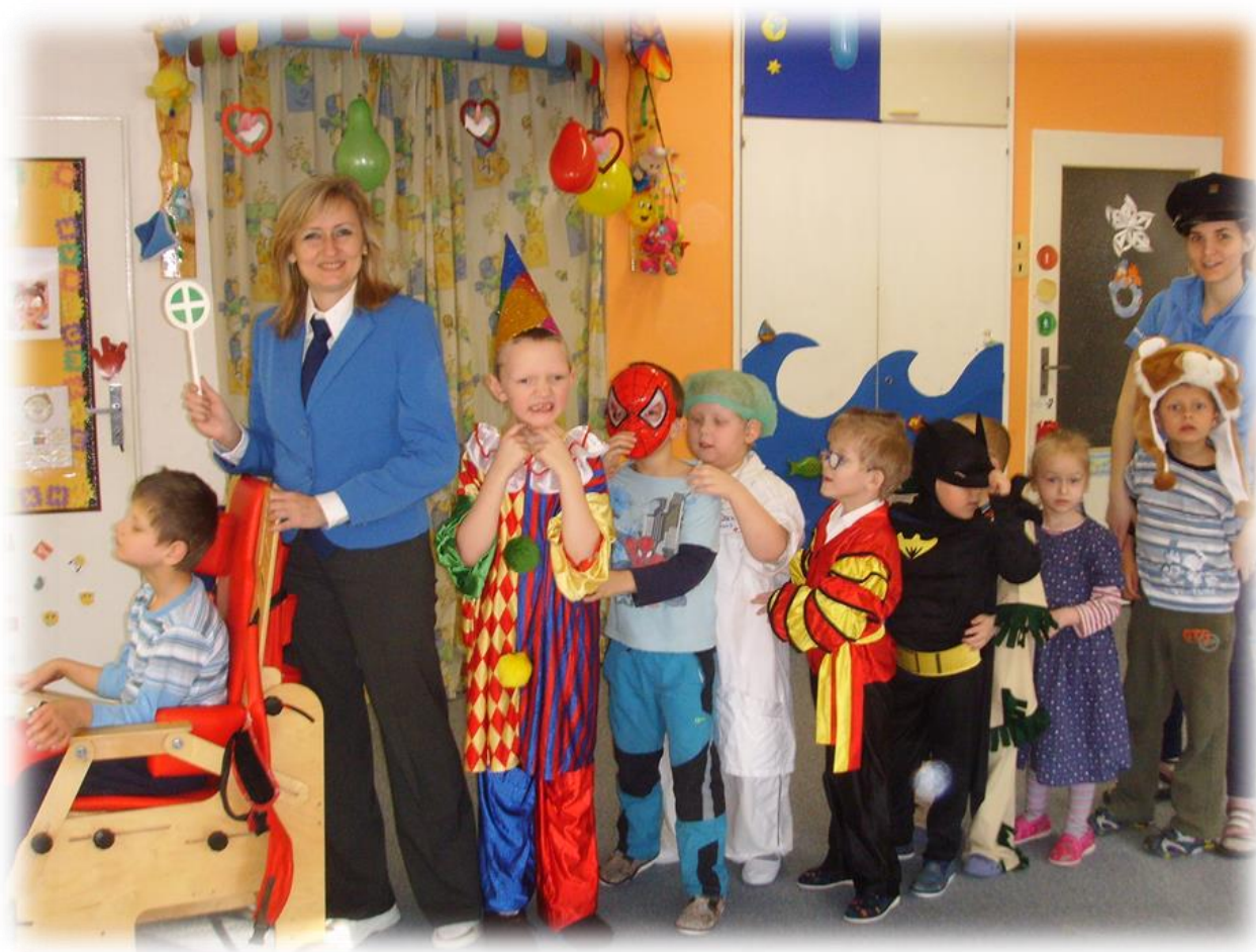
Žáci MŠ Bohumín s paní učitelkou