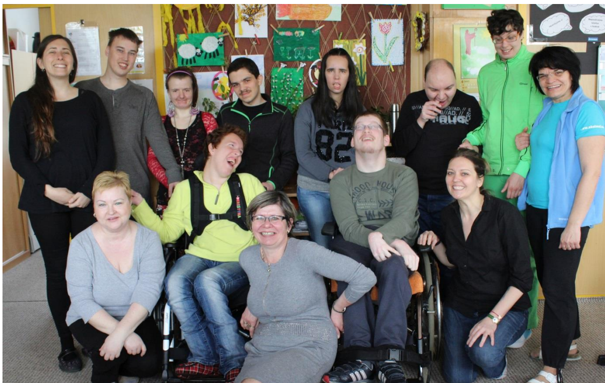
Den se zahraniční dobrovolnicí

V Českém Těšíně byli do prvního ročníku Praktické školy dvouleté přijati 2 žáci, do oboru Praktická škola jednoletá nebyl přijat nikdo. V Bohumíně bylo přijato 5 žáků do Praktické školy jednoleté a 4 žáci do Praktické školy dvouleté. V Karviné jsme přijali 6 žáků do Praktické školy dvouleté a do oboru Praktická škola jednoletá nikdo. V Ostravě jsme přijali 1 žáka do oboru Praktická škola jednoletá a 5 žáků do oboru Praktická škola dvouletá.