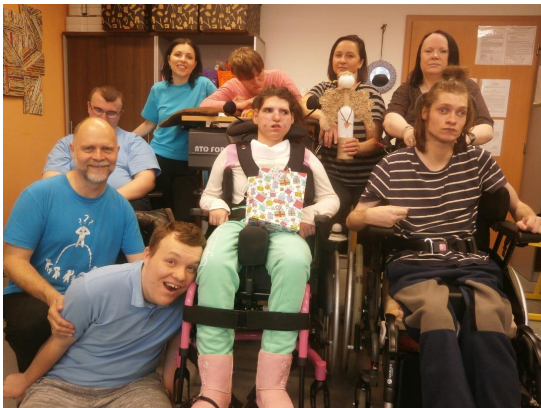
Společná oslava narozenin