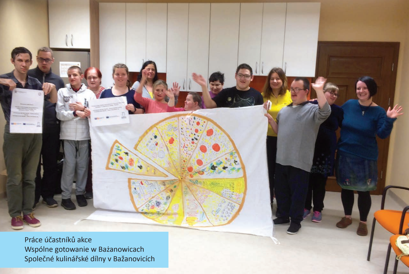
Práce účastníků akce Wspólne gotowanie w Bażanowicach Společné kulinařské dílny v Bažanovicích