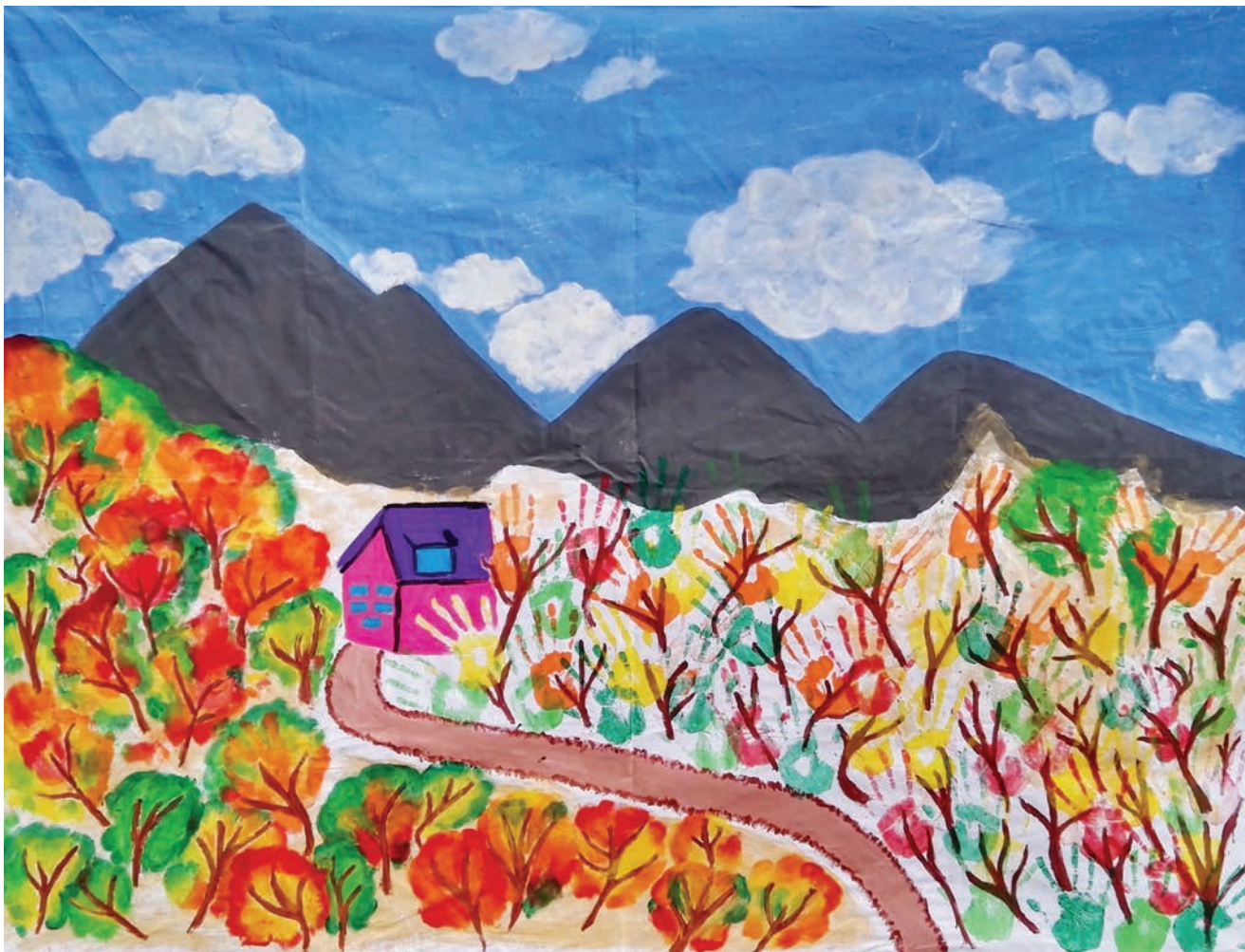
Plótno Integracyjne - integrační plátno Polsko–czeski rajd górski do Chaty Hrádek Polsko–český výšlap do hor na chatu Hrádek