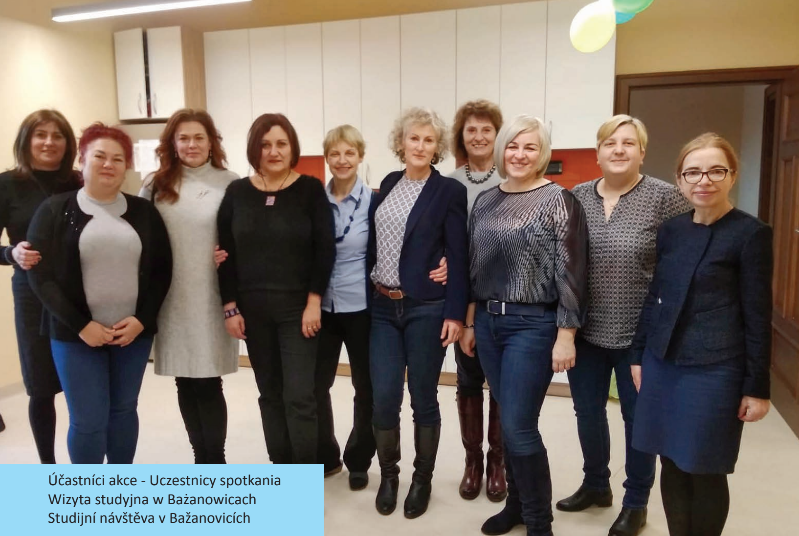
Účastníci akce - Uczestnicy spotkania Wizyta studyjna w Bażanowicach Studijní návštěva v Bažanovicích